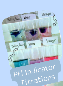
PH Indicator Titrations