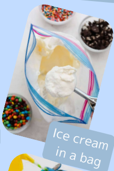
Ice cream in a bag